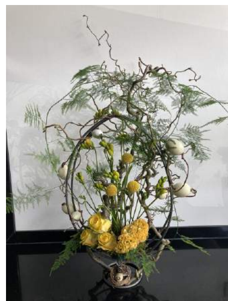
Deze afbeelding dient ter illustratie, mogelijk wordt er tijdens de workshop iets anders

Heb je zin in een middag creatief bezig zijn met mooie lentematerialen en wil je je bloemschikvaardigheden uitbreiden, kom dan naar onze workshop bloemschikken. Workshopleider Monique ter Brugge leert je een aantal basistechnieken en je maakt een mooi bloemstuk. Het onderwerp voor het werkstuk wordt vooraf bepaald door de workshopleider en de materialen en bloemen zijn hiervoor aanwezig. In de uitwerking is er echter veel ruimte voor eigen creativiteit en aanvulling met eigen groen, bloemen of andere materialen bv. uit eigen tuin, is altijd mogelijk. Neem deze dus gerust mee! Koffie/thee en wat lekkers is inbegrepen.